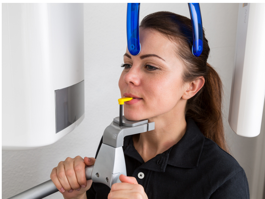
Panoramaröntgen används inom tandvården, men kan nu få utökad betydelse.

Insjuknande i stroke och hjärtinfarkt registrerades under de följande tio åren, eller tills att